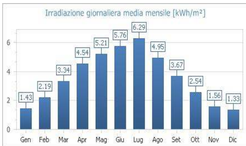
Fig. 1: Irradiazione giornaliera media mensile sul piano orizzontale [kWh/m²]- Fonte dati: UNI 10349 - Località di riferimento: TORINO (TO)/CUNEO (CN)

Quindi, i valori della irradiazione solare annua sul piano orizzontale sono pari a 1 305.01 kWh/m² (Fonte dati: UNI 10349 - Località di riferimento: TORINO (TO)/CUNEO (CN)).